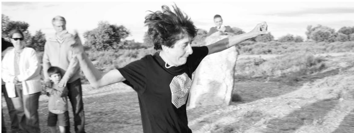
Esther Ferrer, Enterramiento performance a varias velocidades , 2009. Cortesía de El Gallo Espacio de Arte Contemporáneo

Actividades programadas: Sábados 11 y 18 de junio y 2 de julio.